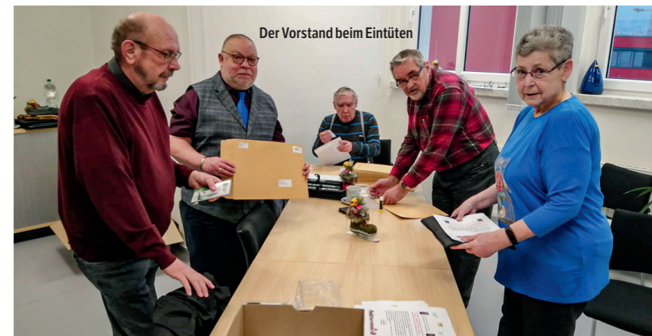
Der Vorstand beim Eintüten