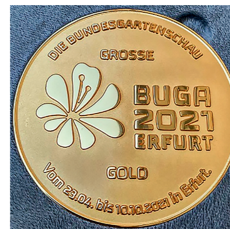
Die große Goldmedaille der BUGA 21

Dadurch dass dies draußen stattfand, konnten wir die Regeln sehr gut einhalten. Des Weiteren waren wir gemeinsam auf der BUGA auf dem Petersberg sowie auf der EGA. Das war natürlich ein Erlebnis, obwohl an diesem