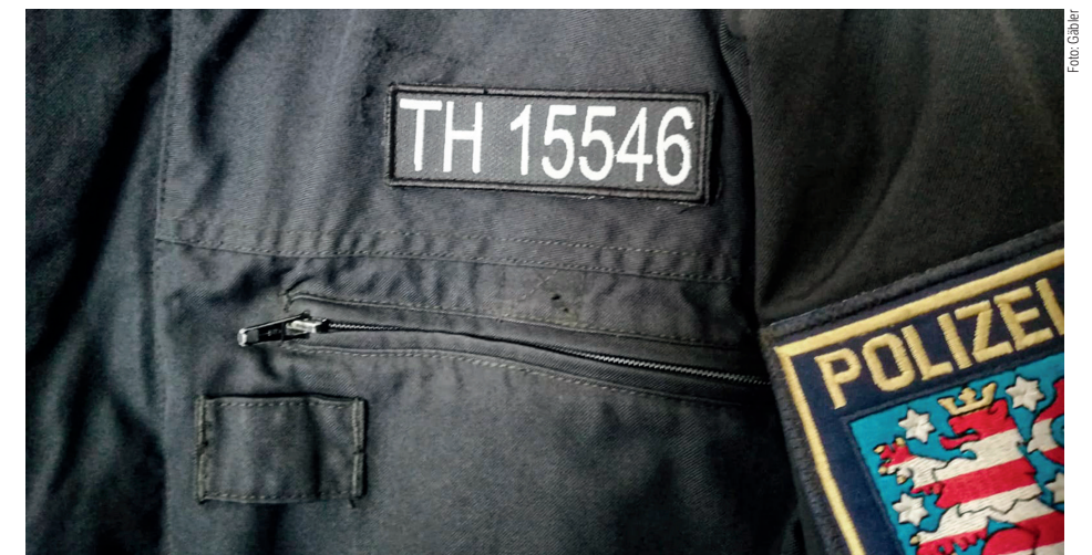
So sieht die numerische Kennzeichnung aus

Nach Ansicht des Ministeriums komplettiert die numerische Kennzeichnung die bereits etablierte Praxis der Verwendung eines Namensschilds an den übrigen Uniformarten. Mithin ist nahezu jeder Uniformträger der Thüringer Polizei individuell erkennbar respektive gekennzeichnet. Diese Offenheit stärkt das Vertrauen in die Polizei und bietet zugleich die Option einer persönlich zuordenbaren rechtlichen Überprüfung polizeilicher Maßnahmen. Daher ist auch eine Evaluierung der Kennzeichnungspflicht bisher seitens des Ministeriums nicht vorgesehen. ■