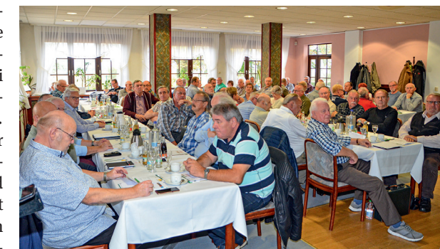
Auch in der GdP wächst die Zahl der Senioren.