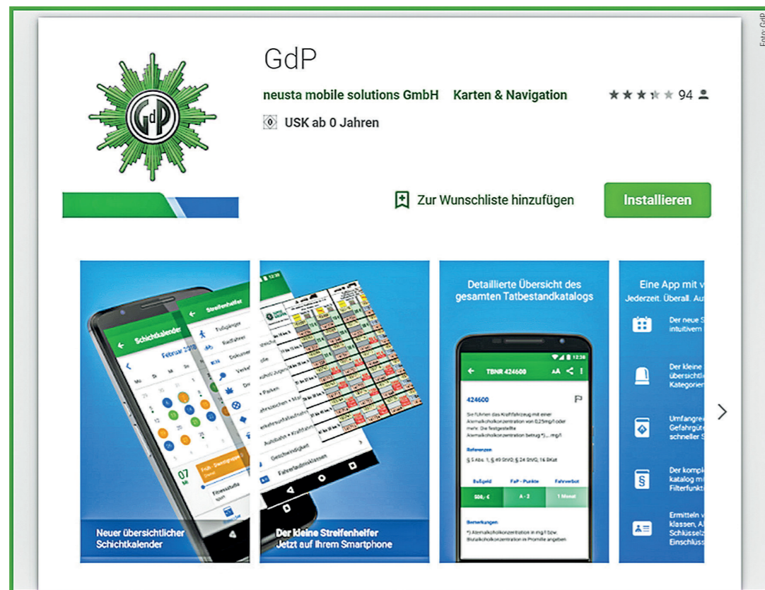
Die GdP-App im App-Shop

Die GdP Thüringen begrüßt sehr, dass die GdP-App auf dienstlichen Endgeräten zur Verfügung gestellt werden soll. Nach Prüfung mit dem Bundesvorstand der GdP darf diese App den Thüringer Beschäftigten kostenfrei auf dienstlichen Geräten verfügbar gemacht werden. Die GdP hofft auf einen baldigen Start und einen reibungslosen Ablauf des Pilotprojektes in Saalfeld. ■