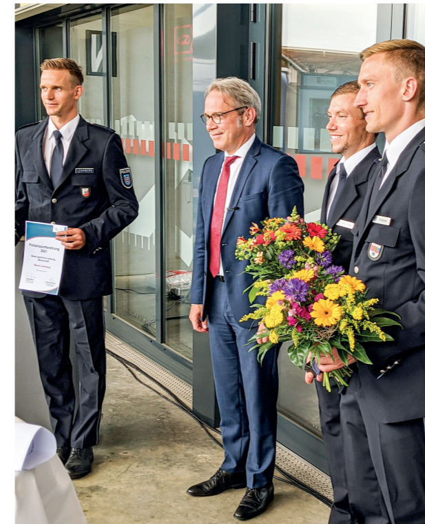
... mit der erfolgreichen Cross-Mannschaft ...