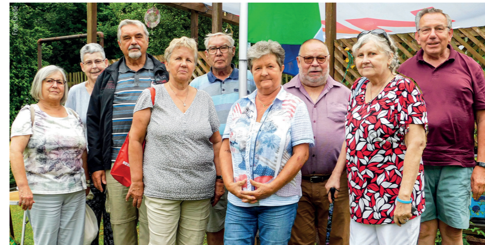
Seniorenvorstand mit Partnern

Am 6. Juli 2021 fand der Vorstand der Seniorengruppe Jena, es sei genug mit der Corona-Pause. Man traf sich gemeinsam mit den Partnern beim Vorsitzenden im Garten und besprach die nächsten Schritte für die Wiederaufnahme der Arbeit der Seniorengruppe. Die nächsten Veranstaltungen sol-