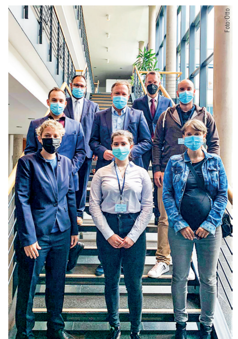
Gruppenfoto mit den CDU-Politikern ...